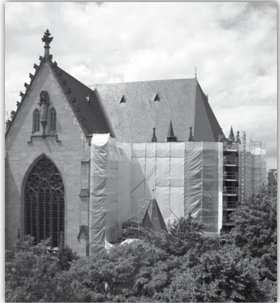
St. Agnes eingerüstet

Das Zusammenwirken der Schichten wurde damals mit Mörtel und einigen wenigen „Drahtankern“