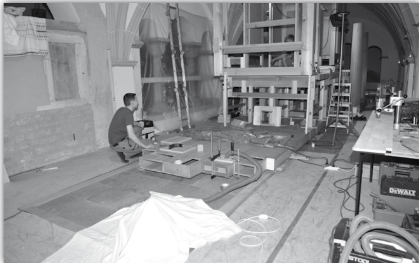
Hier am Boden sieht man gut die Windkanäle, hinten das Schwellwerkgehäuse

Mitte Juli wird der Aufbau abgeschlossen sein. Dann beginnt die eigentliche Arbeit, die Intonation, also die Stimmung der Pfeifen. Hierbei gestaltet der Orgelbauer die Klangfarben, legt die Stammtöne fest und intoniert sie vor. Mit anderen Worten: Er entwickelt dann die