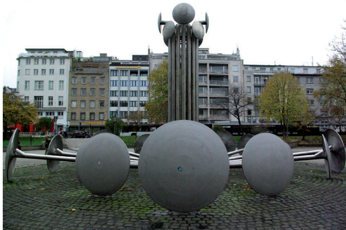
„Der Springbrunnen auf dem Platz war mal ein wunderbarer Spielplatz und Treffpunkt für Familien.“

Die aufwendige Sanierung habe viele positive Ergebnisse erzielt, findet Regina Börschel: „Der Eigelstein ist heute immer noch eine lebhaft, aber für Fußgänger barrierefrei zu kreuzende Einkaufsstraße. Es ist gelungen, Orte zu schaffen, an denen sich Menschen gerne aufhalten.“